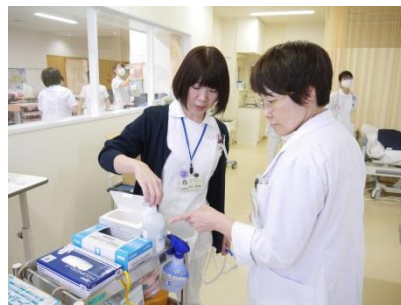
感染管理認定看護師による院内巡視