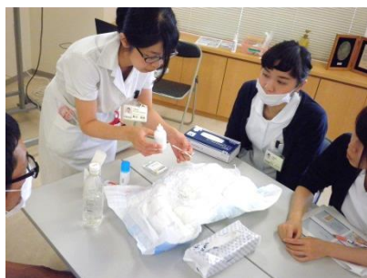
皮膚排泄ケア認定看護師による スキンケア研修